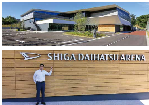
滋賀ダイハツアリーナ

滋賀アリーナ（滋賀タイハツアリーナ）が12月1日（木）にオープン予定。大津市上田上町（滋賀医科大学隣接）