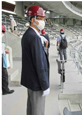
②彦根陸上競技場等の様子