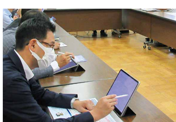
③彦根翔西館高校県民参画委員会の様子

③ 県立彦根翔西館高校…公共交通に対する県民参画委員会を実施 高校生に通学等における鉄道・バスなどの利用に対する意見交換を行う。 学生の皆さんの多くは、通学等