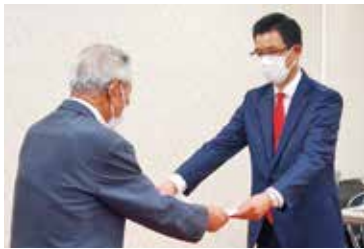
当選証書授与式の様子